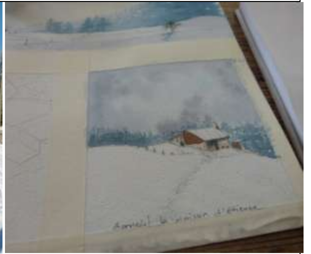
Cet hiver de la neige quoi on en ait dit !