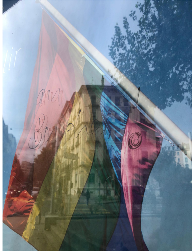
« Au bûcher »