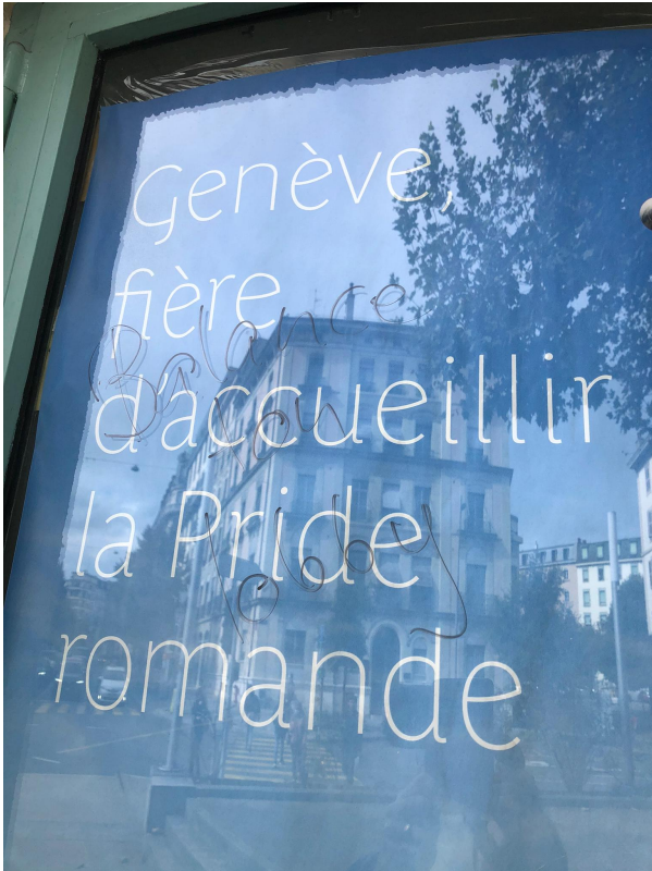
« Balance ton lobby »