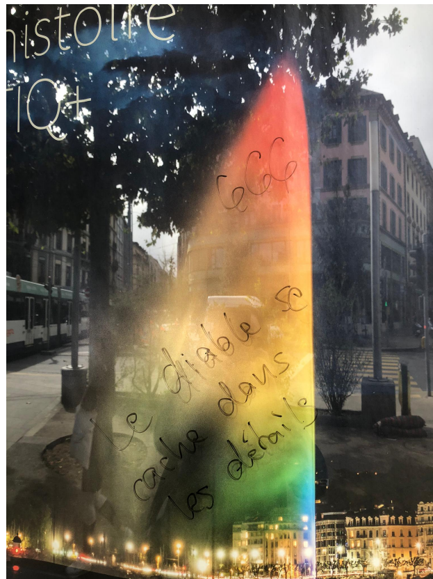
« 666 » et « Le diable se cache dans les détails »